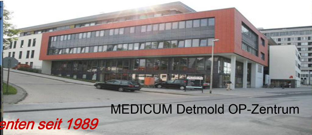
MEDICUM Detmold OP-Zentrum