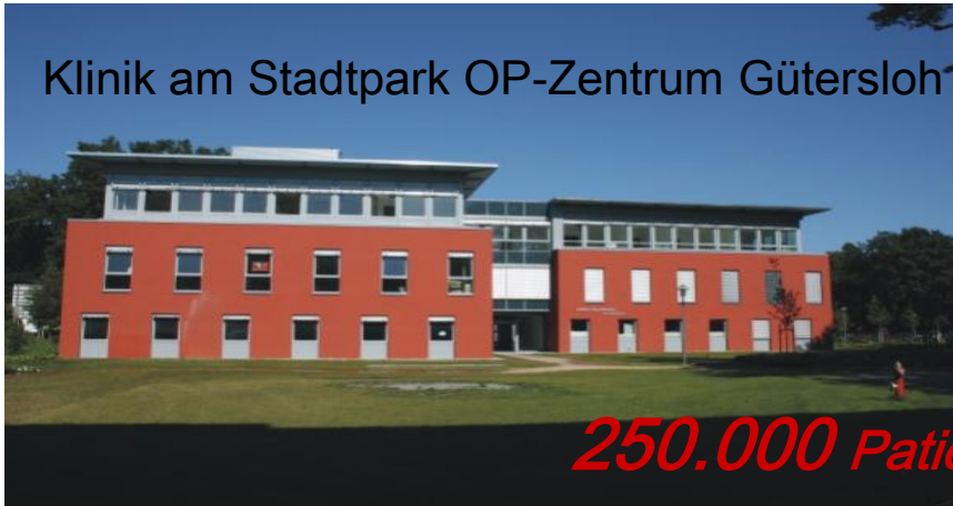
Klinik am Stadtpark OP-Zentrum Gütersloh